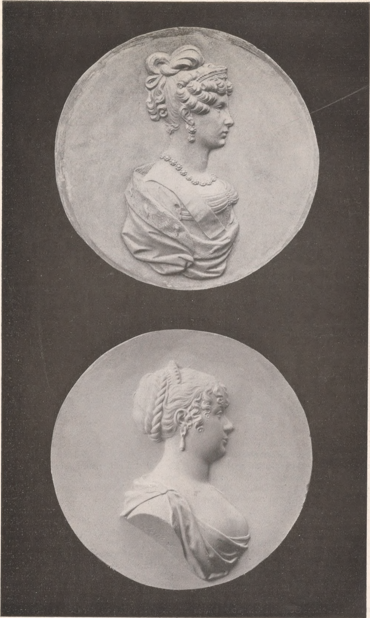
Abb. 143 und 144